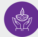
Professionnels des soins spirituels