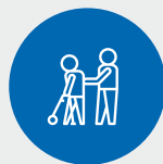
Préposés aux services de soutien à la personne